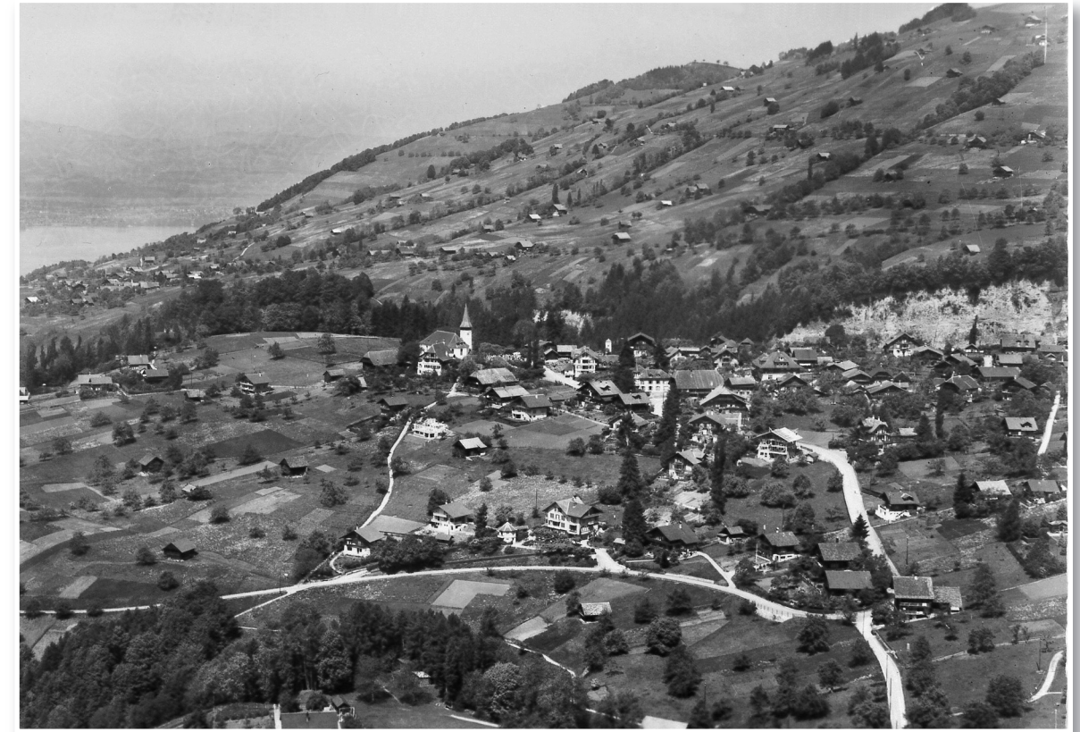
Sigriswil um 1952