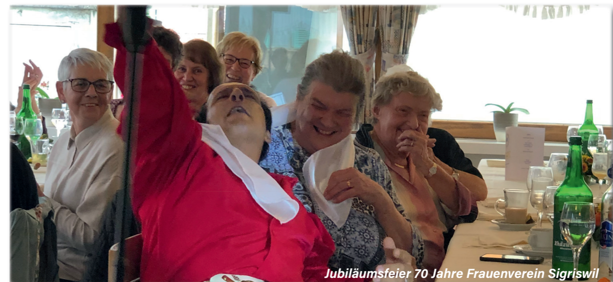
Jubiläumsfeier 70 Jahre Frauenverein Sigriswil